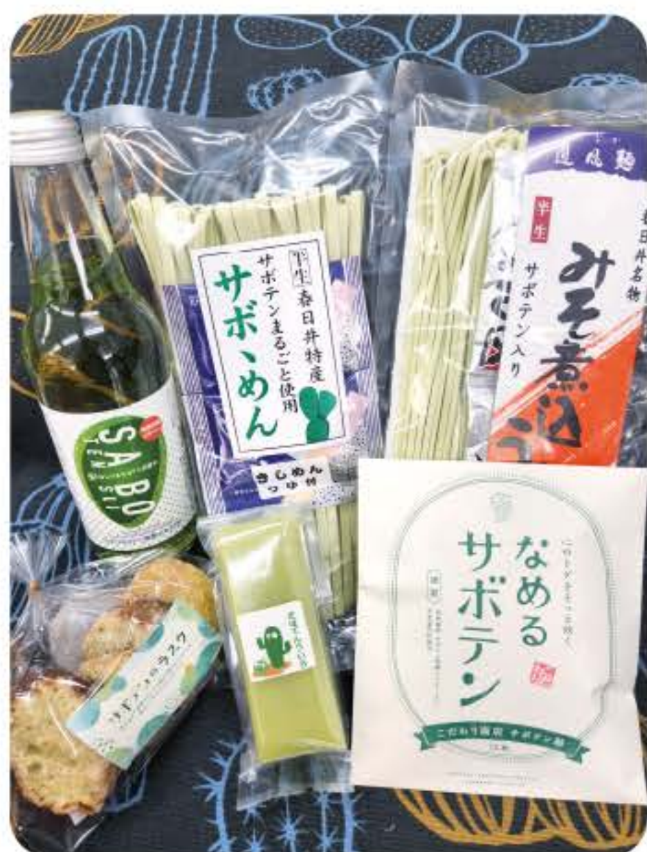
Productos procesados de "Taberu Saboten Taiyo no Ha" (todos especialidades de Kasugai).

¡Aprovechando esta característica, nuestras habilidades profesionales y diversos platos de Cactus-Nopal son populares en